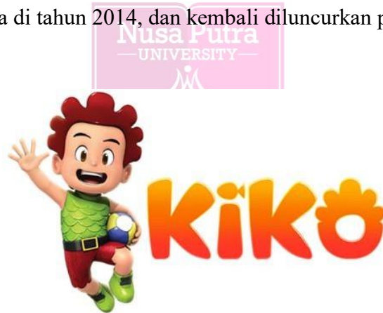
Gambar 1. 1 Karakter Kiko

Dewasa ini, kemajuan teknologi semakin berkembang pesat, sehingga berpengaruh pada kemajuan berbagai bidang industri, termasuk bidang industri kreatif animasi. Penciptaan berbagai macam animasi telah banyak dibuat oleh berbagai industri kreatif. Di Indonesia, bidang animasi sudah berkembang semakin baik seiring dengan berkembangnya teknologi, dapat dilihat dari semakin banyak berbagai macam karya yang dihasilkan oleh banyak studio animasi yang bermunculan seiring berjalannya waktu, terutama dalam pembuatan animasi 3D. Salah satunya adalah serial animasi KIKO yang di produksi oleh MNC Animation dalam fokusnya untuk mengembangkan IP ( Intellectual Property ). MNC Animation sendiri berada dibawah naungan MNC Group. Serial animasi ini sukses dalam musim pertamanya di tahun 2014, dan kembali diluncurkan pada 7 Februari 2016.