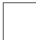
APRILIA FRANSISCA Penulis III