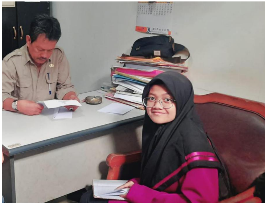
(Gambar 2 : Bersama Kepala Kecamatan Gunungguruh)