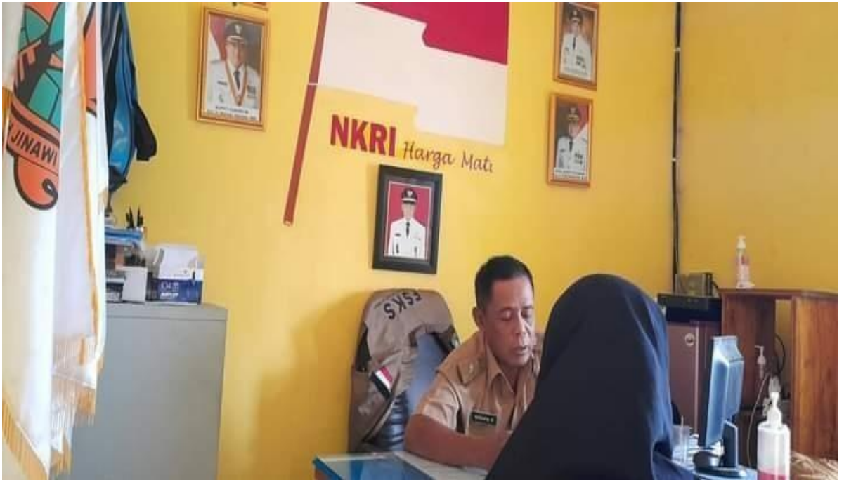
(Gambar 1 : Wawancara Bersama Kepala Desa Kebon Manggu)