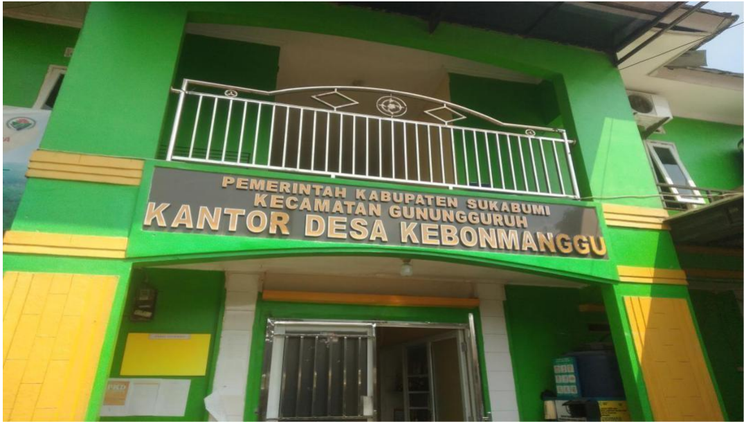
(Gambar 3 : Lokasi Penelitian)